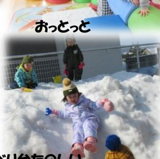
雪すべり台たのしい