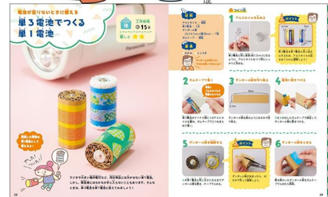
単3電池が単1電池として使える方法です。