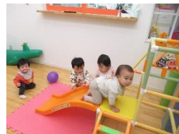
こんな坂、へっちゃらだじよー