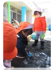
雪…あつめようっと