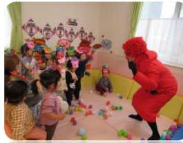
「みんな、元気ー?」と言われても…。みんな、どうする?

思い出いっぱいの絵や制作物を持ち帰ります。数年後に眺めると、その成長に驚き、いろいろ懐かしい思い出がよみがえってきます。大事な宝物ですね。