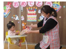
お誕生日、おめでとうー!