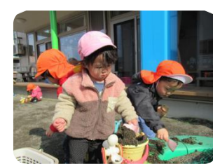
冬でも、暖かい日はお庭で砂遊びー♪