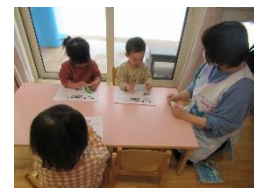
シール貼り、どれにしよう…。