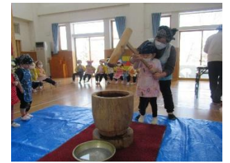
にいにみたくに、よいしょ〜!!