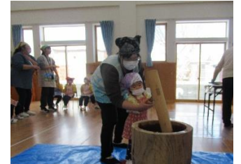
先生、あたちのサポート頼むね〜!