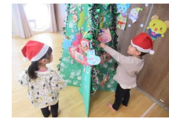
手作りのおつきいツリーにお願い事をつけてっど…。