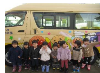
あんぱん号いに乗って幼稚園に行くんだ〜♪

21日の「ぺったん ぼったん〜♪」のもちつき大会と12月25日のサンタの集いを楽しみました。