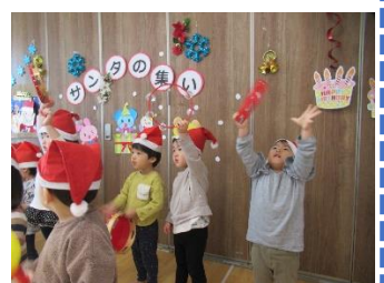
見て! このタンバリンさばきを! イェーイ